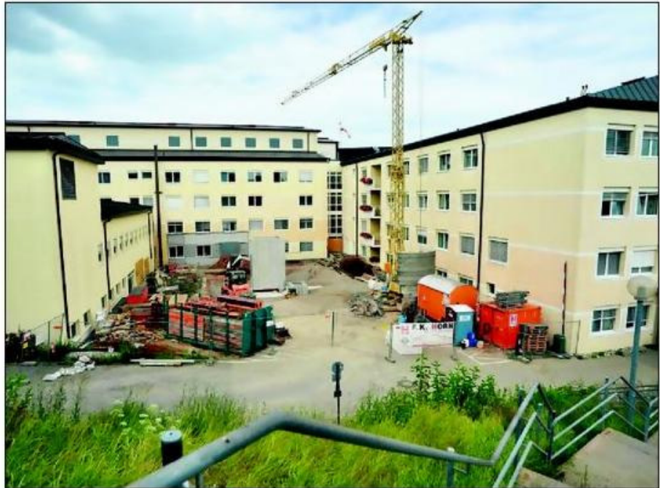
Komplett neu gestaltet wird der Innenhof des Krankenhauses: Deswegen ist die Notfallambulanz (im Gebäude links) derzeit nicht erreichbar. Die Rettungswagen bringen Patienten, die liegend transportiert werden, bis auf weiteres zu einem provisorischen Einlass im Gebäude rechts.

„Wir sind im Zeit- und Kostenplan“, sagte Verwaltungsdirektor Claus Wadle am Freitag auf RHEINPFALZ-Anfrage. In der Erde verschwunden ist bereits der künftige Verbindungstunnel zwischen Krankenhaus-Haupthaus und dem mitten im Hof geplanten Wirtschaftsgebäude, das sämtliche Abfälle aufnehmen wird. Hier ragt derzeit der Betonschacht für den Lastenaufzug in die Höhe. In dieser Woche soll die Bodenplatte entstehen, über die die Krankenwagen künftig die Ambulanz erreichen. Mit dieser Zufahrt für liegend Kranke wird auch die Verkehrsführung der Rettungswagen geändert. (dts)